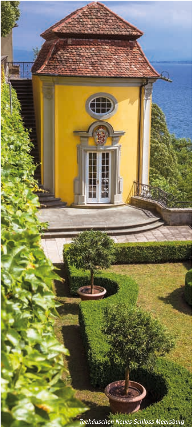
Teehäuschen Neues Schloss Meersburg