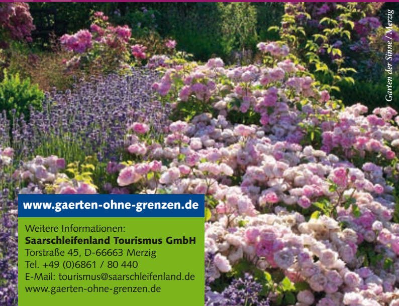
Gärten der Sinne / Merzig