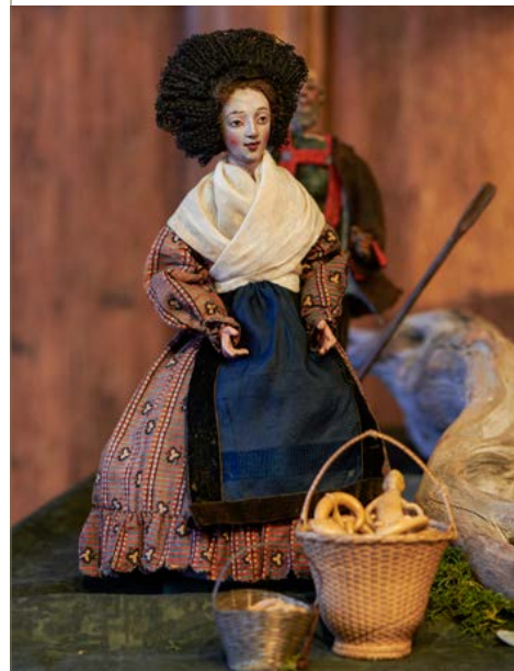
Detail aus der Konstanzer Weihnachtskrippe, Rosgartenmuseum