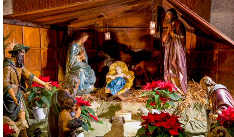
Münster Unserer Lieben Frau, Radolfzell