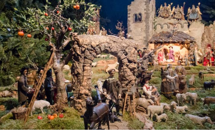
Münster St. Nikolaus, Überlingen