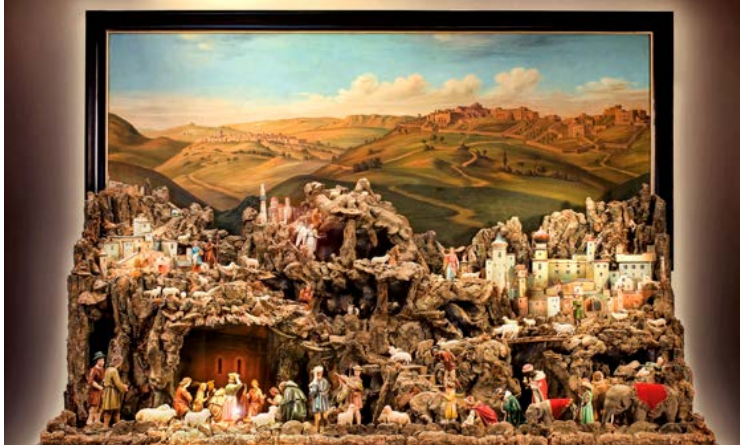
Historische Weihnachtskrippe des Museum Biberach