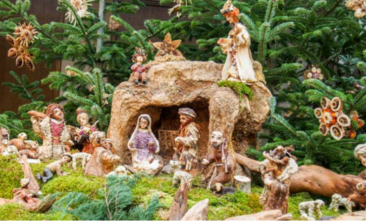
Naturkrippe, Kloster Sießen, Bad Saulgau