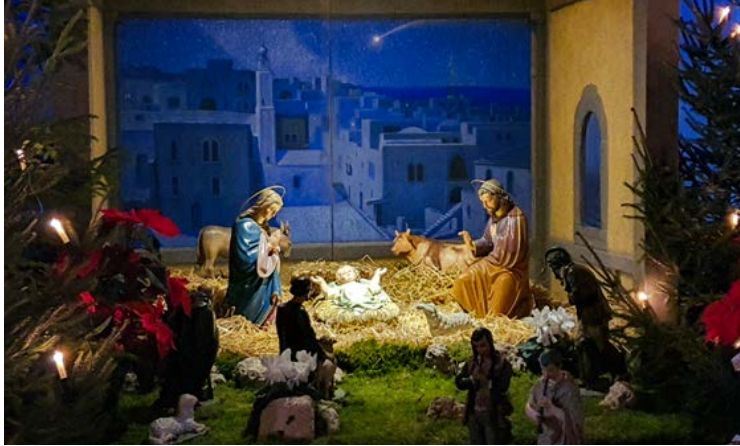
Krippe im Münster, Reichenau