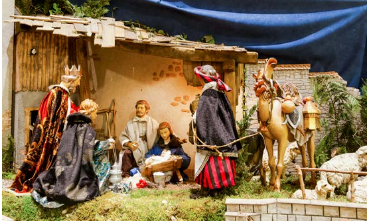
St. Nikolaus, Aach