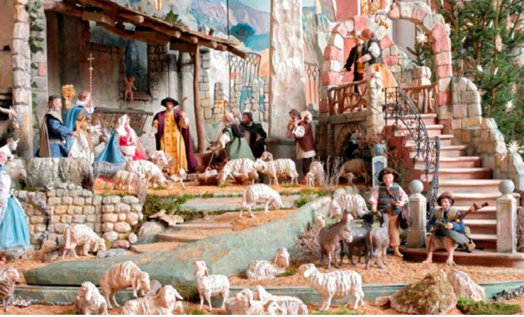
Inzigkofer Weihnachtskrippe